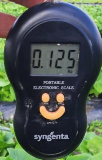
Huseby, Lier 18.05.21