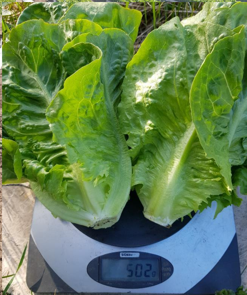
Bjertnæs & Hoel, Vestfold 18.05.21