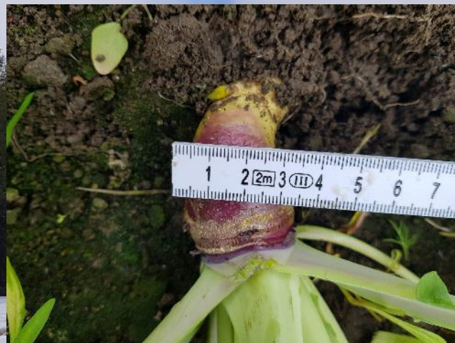
Ø. Gudem, Brunlanes